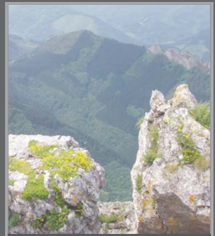
AIZKORRANDI OU INTZARTZU (811)