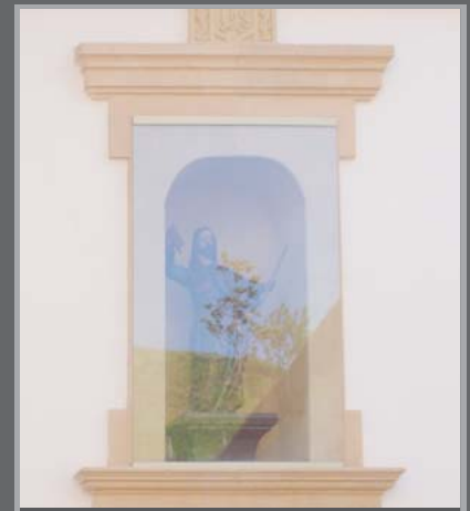
STATUE DE SANTIAGO

Le chemin de Saint Jacques de Compostelle d'Ataun est une branche du chemin qui parcourt l'intérieur du Guipúzcoa. L'itinéraire de ce chemin était le suivant : Ordizia, Lazkao, San Martín de Ataun, San Gregorio, Ergoiena, Atxurrene, chaussée de Berrenoa, Urdiain, Urbasa, Bakedano, LIZARRA. Avec l'église, cette statue représente l'un des rares vestiges laissés par le chemin de Compostelle. Il y eût ici un hôpital de pèlerins, mais il ne reste aujourd'hui que cette statue de bois. En 1993, pour l'Année de Saint Jacques, Arteleku analysa la statue, qui est depuis protégée.