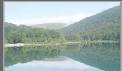
L'EMBASSAMENT DE LAREO

L'embassament de Lareo es va construir en 1989, en el paratge envoltat pels cims Malkorburu, Sarastarri, Akaitz i Alleko, per a assegurar el cabal ecològic del riu Agauntza i el proveïment d'aigua dels ataudarras. Té una extensió de 20 hectàrees i un volum de 2,35 hm 3 .