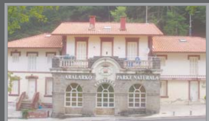
CASA DEL PARC DE LIZARRUSTI

La cueva fue cavada en 1916 por alguien de apellido Arana. El camino de paso labrado en la roca fue utilizado como carbonera y también para extraer piedra del monte; más tarde también fue utilizado por la empresa Quifosa para el transportar madera para la fabricación de alcohol.