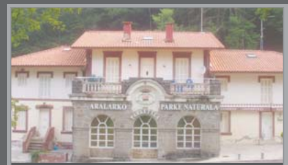
MAISON DU PARC DE LIZARRUSTI

Ce tunnel fut construit en 1916 par un homme nommé Arana. Il est creusé dans la roche et servait à faire descendre le charbon végétal et les pierres de la montagne. Plus tard, il fut utilisé par l'entreprise Quifosa pour transporter du bois de hêtre destiné à la fabrication d'alcool.